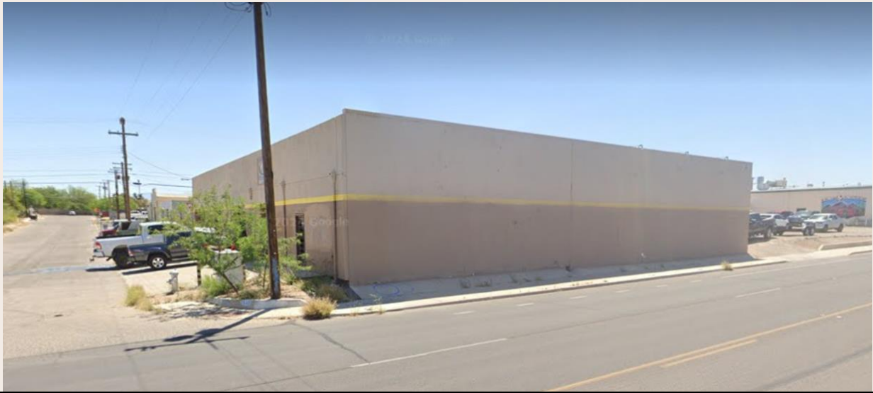
Límites de Sugar Hill; Grant, 4th Ave, Seneca, 1st Ave, Lee St, Stone.